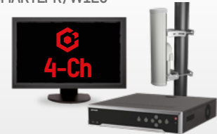
Paquete HikCentral-P-VSS-Base 4Ch-SMARTLPR/W120