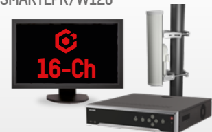
Paquete HikCentral-P-VSS-Base 16Ch-SMARTLPR/W120