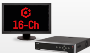
Paquete HikCentral-P-VSS-Base/ 16Ch-SMARTLPR