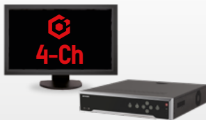
Paquete HikCentral-P-VSS-Base/ 4Ch-SMARTLPR