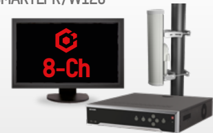
Paquete HikCentral-P-VSS-Base 8Ch-SMARTLPR/W120