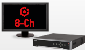
Paquete HikCentral-P-VSS-Base/ 8Ch-SMARTLPR