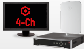
Paquete HikCentral-P-VSS-Base 4Ch-SMARTLPR/W