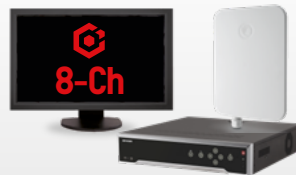
Paquete HikCentral-P-VSS-Base 8Ch-SMARTLPR/W