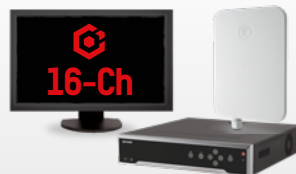
Paquete HikCentral-P-VSS-Base 16Ch-SMARTLPR/W